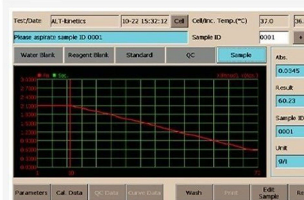
Gráfico de reação on-line para testes químicos